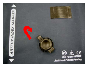
取り付けたカフポートプラグを折り返し、密閉します。