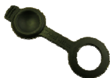
カフポートプラグ(表面)